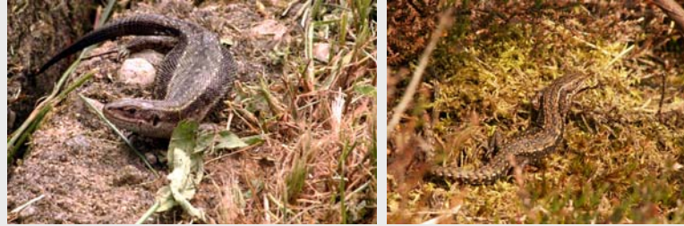
Die Waldeidechse ( Zootoca vivipara ) gehört zur Klasse der Reptilien und zur Familie der Echten Eidechsen ( Lacertidae ).