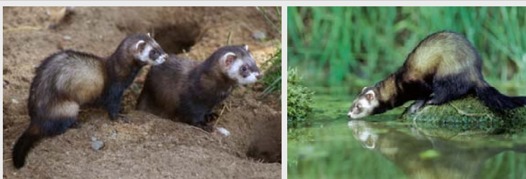
Der Europäische Iltis oder Waldiltis ( Mustela putorius ) ist eine Raubtierart aus der Familie der Marder ( Mustelidae ).