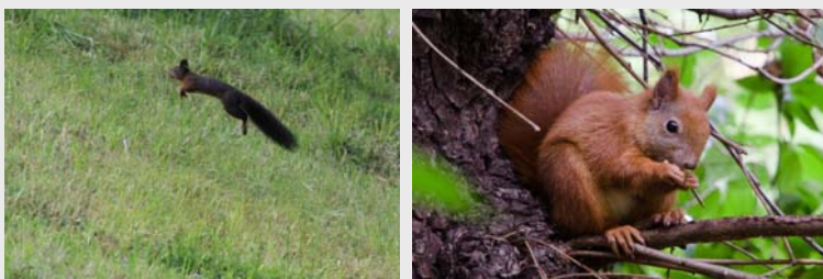
Das Eichhörnchen ( Sciurus vulgaris ) ist ein Nagetier aus der Familie der Hörnchen ( Sciuridae ).