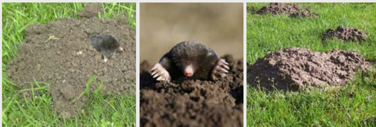
Die Maulwürfe ( Talpidae ) sind eine Säugetierfamilie aus der Ordnung der Insektenfresser ( Eulipotyphla ).