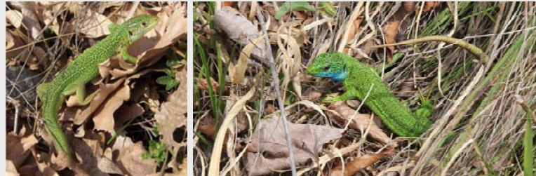
Die Östliche Smaragdeidechse ( Lacerta viridis ) ist eine große europäische Eidechsenart mit grüner Grundfärbung.