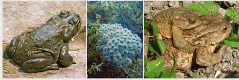
Die Echten Kröten ( Bufo ) gehören zur Familie der Kröten ( Bufo ), die zur Ordnung der Froschlurche ( Anura ) gehört.