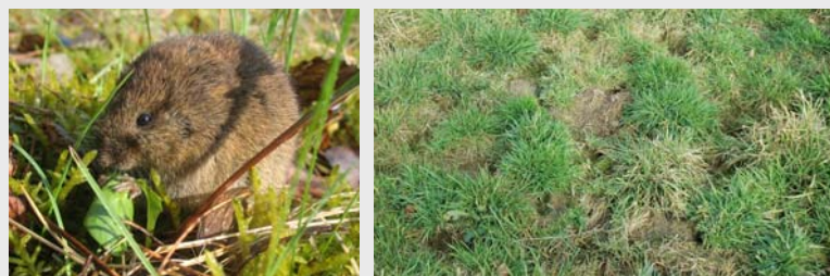
Die Feldmaus ( Microtus arvalis ) ist ein Säugetier aus der Unterfamilie der Wühlmäuse ( Arvicolinae ).