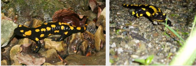
Der Feuersalamander ( Salamandra atra ) ist eine europäische Amphibienart aus der Familie der Echten Salamander .