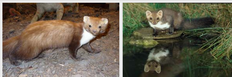
Der Steinmarder ( Martes foina ), oft auch Hausmarder genannt, ist eine Raubtierart aus der Familie der Marder ( Mustelidae ).