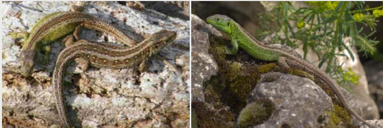
Die Zauneidechse ( Lacerta agilis ) ist ein verbreitetes Reptil aus der Familie der Echten Eidechsen ( Lacertidae ).