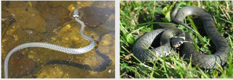
Die Ringelnatter ( Natrix natrix ) ist eine zur Familie der Nattern ( Colubridae ) gehörende Schlangenart.